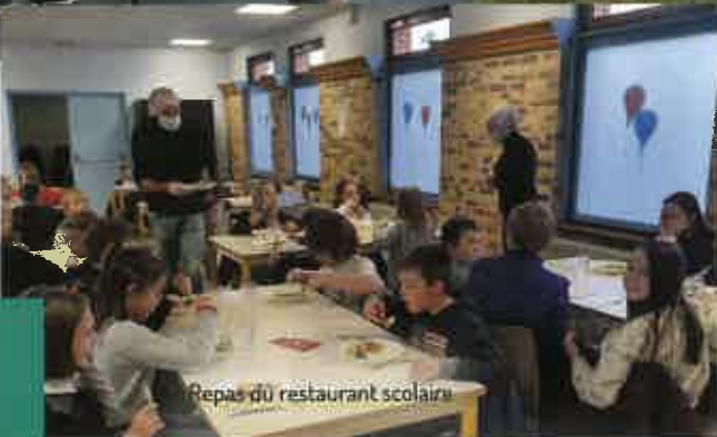
Repas du restaurant scolaire