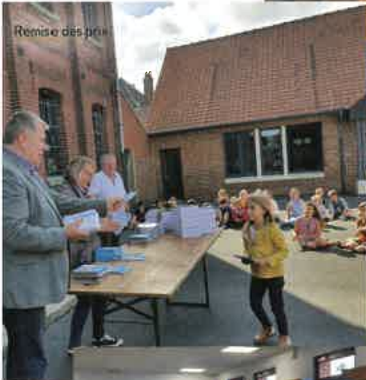
Remise des prix