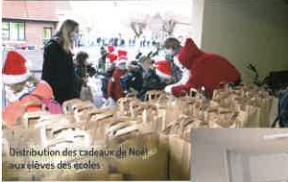
Distribution des cadeaux de Noël aux élèves des écoles