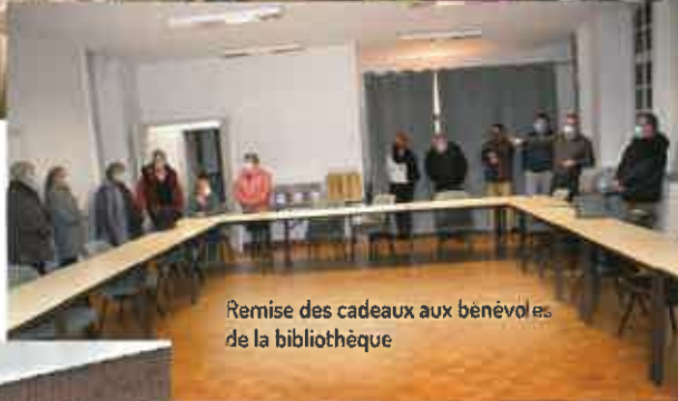
Remise des cadeaux aux bénévoles de la bibliothèque